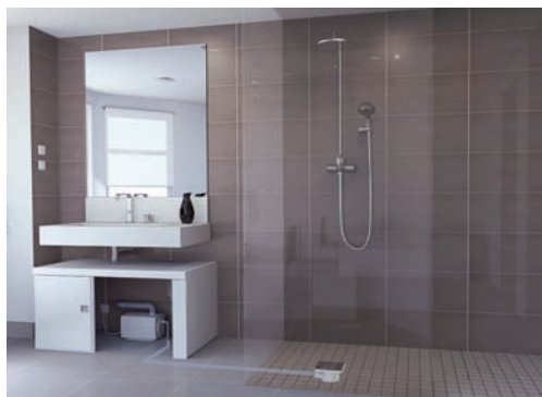
Nouveauté 2014, SANIFLOOR ® de SFA permet d'installer une douche à l'italienne en l'absence d'écoulement gravitaire.

Ce concept permet enfin d'installer la pompe à l'extérieur de la douche, ce qui évite des travaux supplémentaires dans le sol. Elle peut être placée jusqu'à 3 mètres à l'horizontal du siphon ou jusqu'à 30 cm au-dessus du sol. Ses petites dimensions 27 cm (L) x 18 cm (H) x 18 cm (l) permettent de la dissimuler dans un meuble de salle de bains.