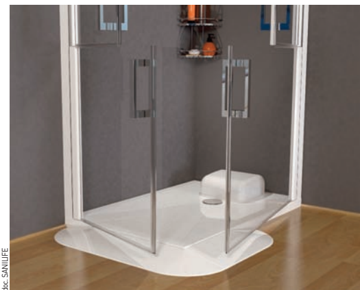
Avec ses proportions adaptées et ses rampes d'accès, le receveur TRAYMATIC ® antidérapant offre une réponse pertinente aux nouvelles problématiques d'accessibilité.

SFA revoit également ses références de receveurs de douche extraplats TRAYMATIC ® , les dotant d'améliorations sensibles, promettant ainsi des performances d'utilisation décuplées... Ces receveurs de douche disponibles en trois tailles, prêts à poser n'importe où, munis d'une pompe de relevage intérieure ou extérieure, s'avèrent être une solution ingénieuse pour répondre simplement et efficacement à un besoin de salle de bains supplémentaire, créer un espace douche sans engager de gros travaux. Lancés début 2009, les TRAYMATIC ® de SFA ont réalisé une entrée remarquée sur le marché grâce à leurs nombreux atouts et leur concept efficace : permettre à chacun d'installer rapidement et sans effort une douche, n'importe où dans son habitation sans engendrer de gros travaux.